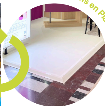
Les cloisons en Plancher technique