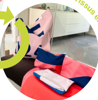
Les Tissus en sacs & troussees