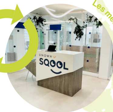
Les meubles Réutilisés